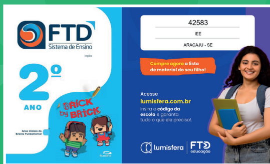
Livro de Inglês Acessar lumisfera.com.br