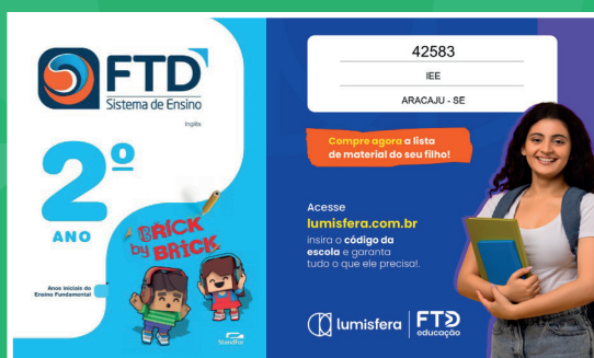
Livro de Inglês Acessar lumisfera.com.br